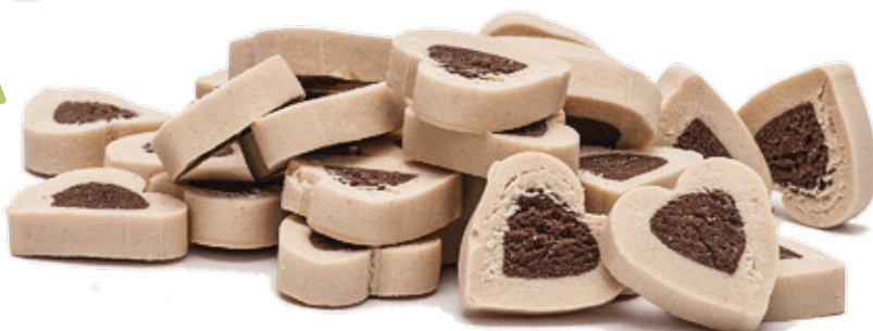
Przysmak z królika