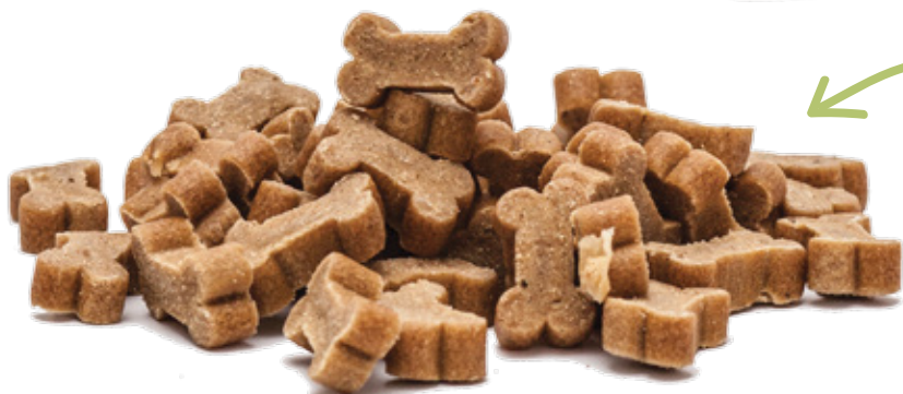
Jagnięcina z ryżem