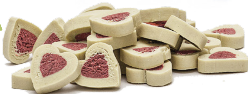
Przysmak ze strusia