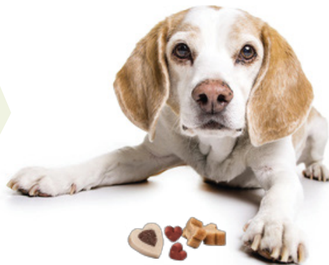
Łosoś z ryżem